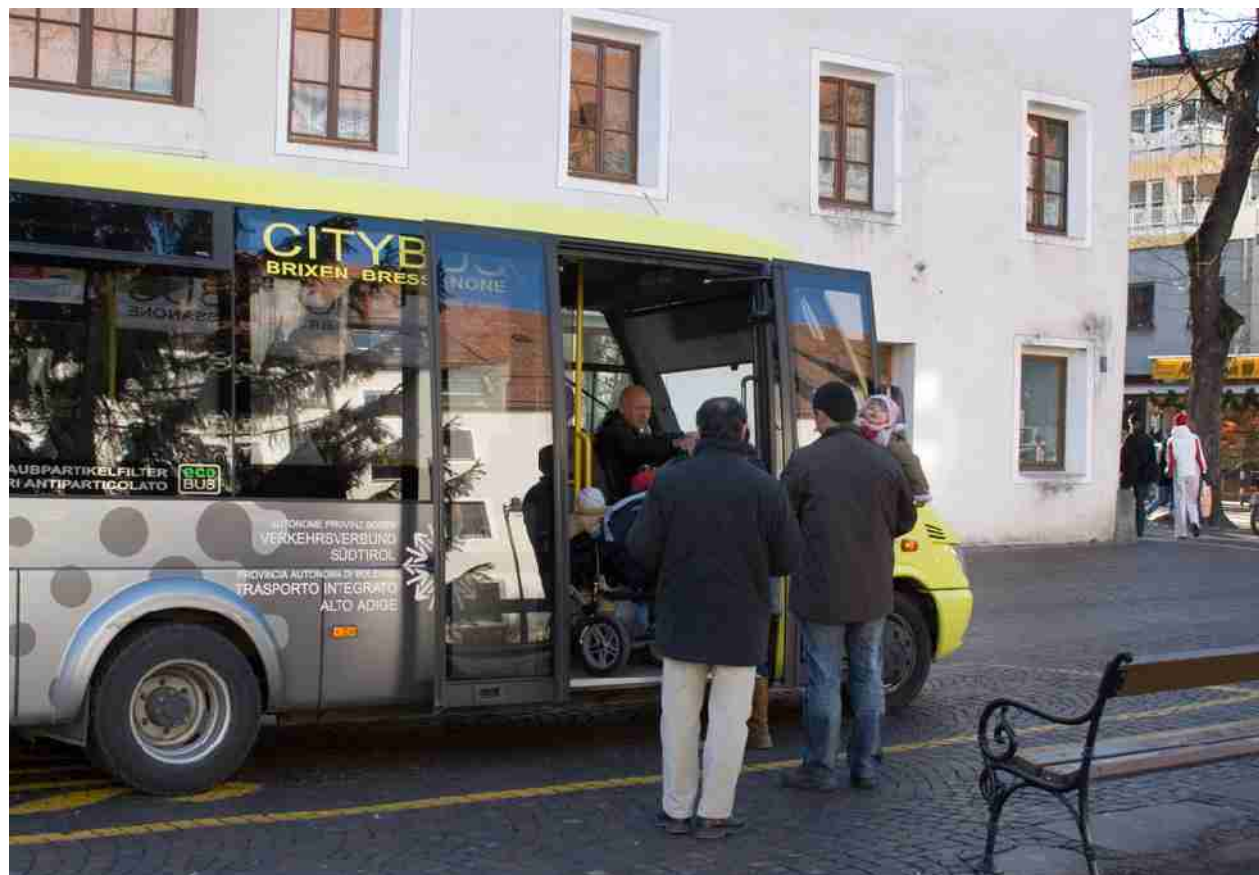
Fotografia: © Qnex – Citybus - Bressanone