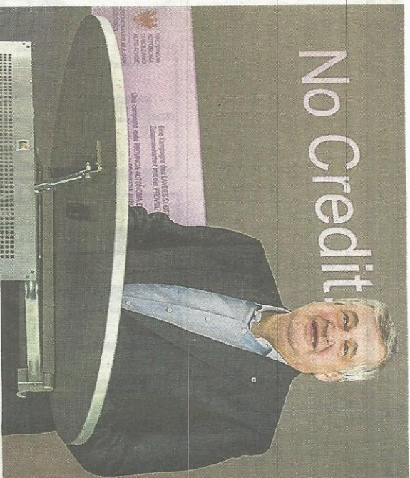
L'assessore provinciale alla mobilità Florian Mussner

si è verificato un radicale cambiamento: mentre pochi anni fa ancora il 36% degli abitanti andava al lavoro in macchina, ora sono solo il 27% mentre il 26,3% usa la bicicletta (mentre nei comuni più piccoli sono solo 4,4%). Nelle vallate periferiche la corriera viene usata dal 8,9% degli abitanti dei comuni con meno di 15 mila abitanti ogni giorno.