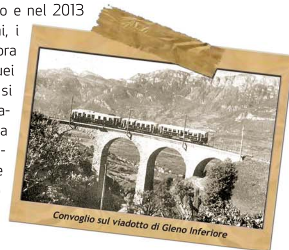
Convoglio sul viadotto di Gleno Inferiore

i Comuni, le Associazioni, i valligiani e i turisti che ancora conservano il ricordo di quei viaggi indimenticabili, si sono uniti in un gruppo di lavoro per far rivivere questa ferrovia attraverso una variegata serie di eventi che si presenteranno nel corso di tutta l'estate del 2013.