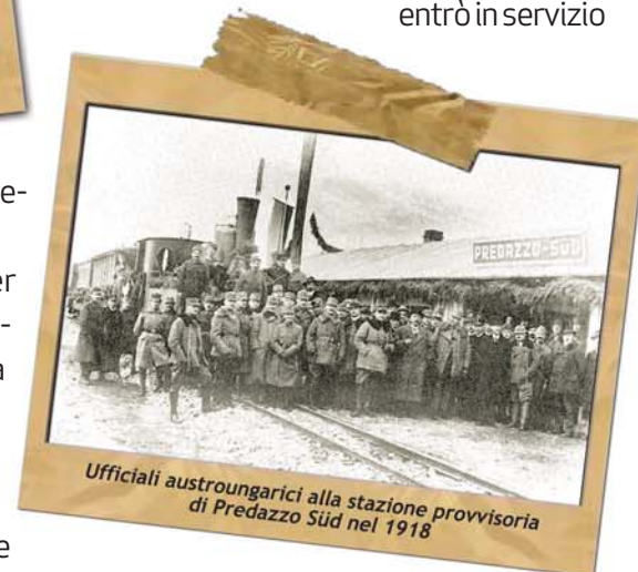
Ufficiali austro-ungarici alla stazione provvisoria di Predazzo Süd nel 1918

il tratto Castello di Fiemme-Predazzo. Progettata inizialmente per le priorità belliche collegate allo scoppio della Prima Guerra Mondiale, quando nel novembre del 1918 la guerra ebbe fine essa ebbe un utilizzo civile e turistico. Sempre in quell'anno on il passaggio del Trentino e Alto-Adige all'Italia la gestione passò al Genio Militare italiano ed il 31 dicembre 1917 alla "FEVF", Ferrovia Elettrica della Val di Fiemme.