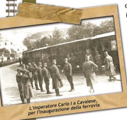
L'imperatore Carlo I a Cavalese, per l'inaugurazione della ferrovia

La Ferrovia della Val di Fiemme era una ferrovia a scartamento ridotto attiva dal 1917 al 1963, che congiungeva la ferrovia del Brennero alla Val di Fiemme. I lavori di costruzione iniziarono nell'inverno del 1915-16 e ad essa parteciparono sino a punte massime di 6000 uomini tra civili, militari e prigionieri tra questi prevalentemente serbi e russi. Nel tratto terminale si aggiunse anche il contributo di numerose donne. A metà marzo del 1917 la ferrovia funzionò nel tratto tra Ora-Castello di Fiemme e successivamente il 1° febbraio 1918 entrò in servizio