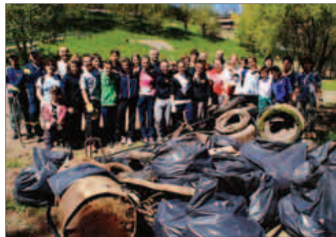
Il gruppo dei partecipanti alla giornata