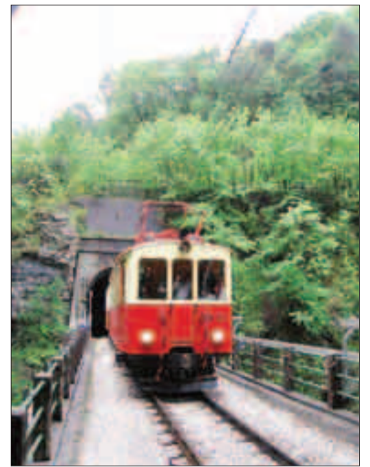
Il treno storico della Trento-Malé

Moena | Assegnato dal ministro Martina in occasione di Cibus