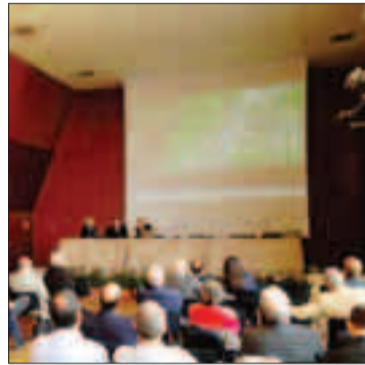
Il convegno di Milano sulla ferrovia

Finkbohner, professionista di Zurigo, ha spiegato che fino agli '80 del secolo scorso pure in Svizzera le ferrovie erano a rischio, minacciate dal ruolo della strada. Poi, ci fu la svolta, e il Paese decise di investire sulle ferrovie. Cosa che non ha fatto l'Italia. Per non perdere di nuovo il treno, Transdolomites lavora su più tavoli per promuovere il collegamento transdolomitico. E a Milano sono stati in particolare illustrati gli studi relativi alla ferrovia Trento-Penia e all'ipotesi di collegamento da St. Moritz e Tirano attraverso le valli del Noce e Trento.