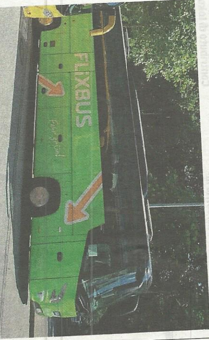
Un autobus verde della piattaforma FlixBus

In crescita anche il numero di chi utilizza il bus per recarsi in aeroporto. La rete FlixBus, che in Italia conta 170 destinazioni, raggiunge infatti anche gli aeroporti di Malpensa, Orto al Serio, Venezia e Fiumicino. Dall'inizio dell'attività nel luglio 2015 FlixBus ha calcolato